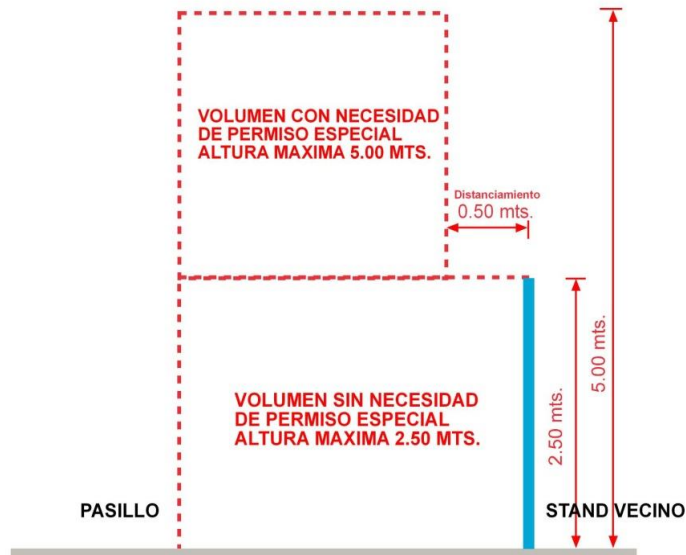
Esquema de elevación lateral